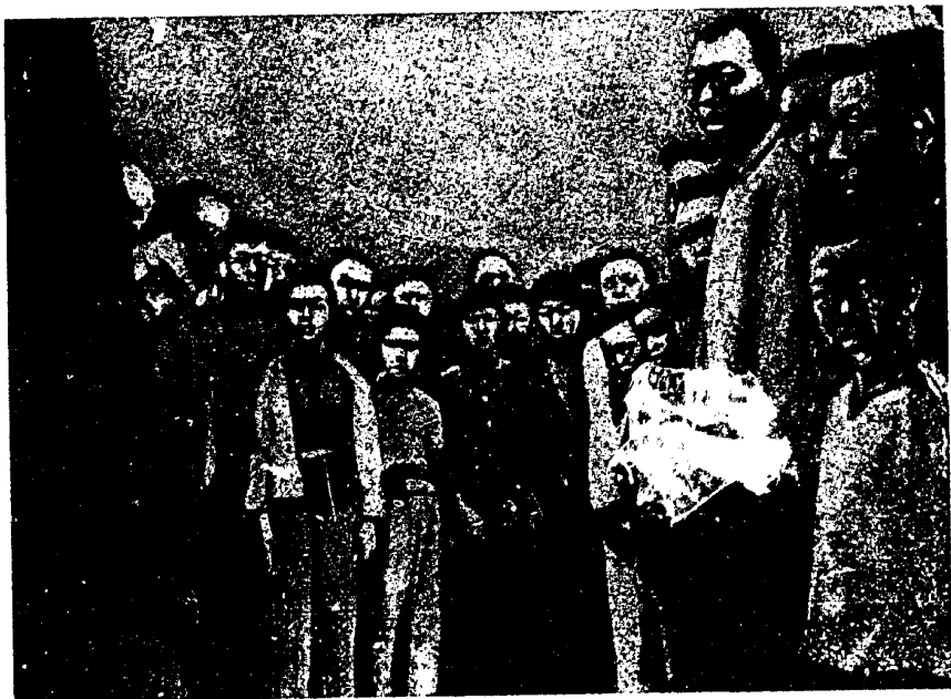
קינדער — ארבעטער אין כינע

אפט פארקויפן די עלטערן זייערע קינדער פאשעט פאר שקלאפן צו די באלעבאטיס. אין 1924 יאר איז אנטבלעקט געווארן א פאל פון עכטער שקלאפעריי. אין איינעם א ווארשמאט זיינען געפונען